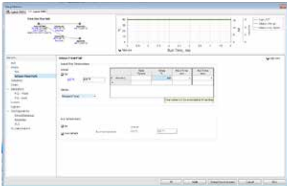
Figura 1. Se recomienda usar el chip puente a la misma temperatura que el inyector, 110 °C para este método de espacio de cabeza.

El Guard Chip o chip puente es un parámetro de los métodos Intuvo que debe configurarse para el correcto funcionamiento del sistema GC. El chip puente se puede utilizar empleando el modo Rampa de temperatura y mantenerse a la misma temperatura que el inyector (Figura 1).