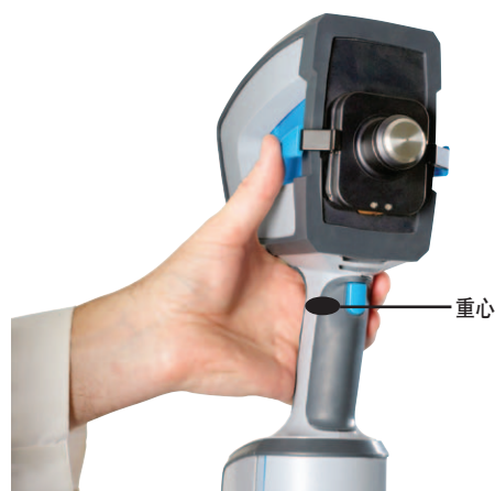
图 1. Agilent 4300 手持式 FTIR。重心位于把手的中心，如图上的黑点所示。此设计使得仪器在用户手中平衡性更好，使用舒适度更高以便连续进行数据采集