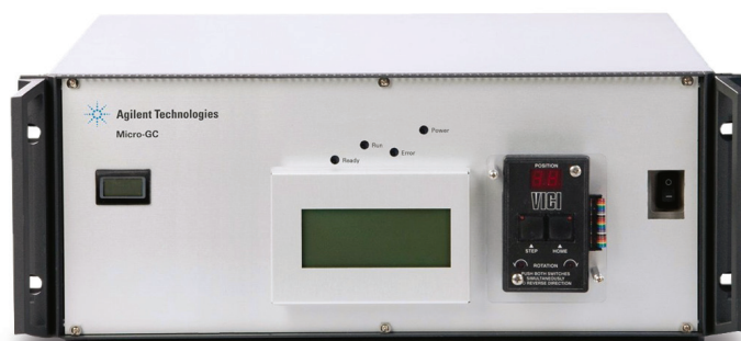
Рисунок 1. Agilent 490 Micro GC в исполнении для установки в стойку 19".