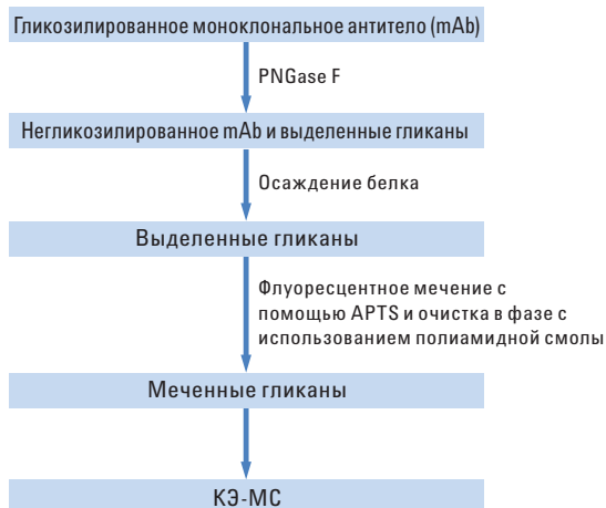
Схема 1 Схематическое изображение определения гликопрофиля mAb методом КЭ-МС.